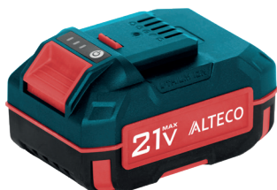
BCD 21-40 Li, BCD 21-50 Li, BCD 21-60 Li