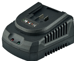
BC 18F, BC 20-2.4, BC 20-4