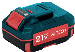
BCD 21-40 Li, BCD 21-50 Li, BCD 21-60 Li